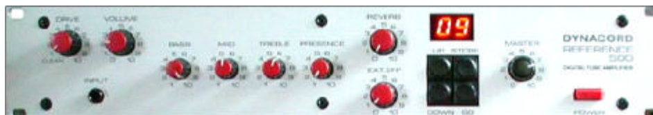
19" - Rackvariante